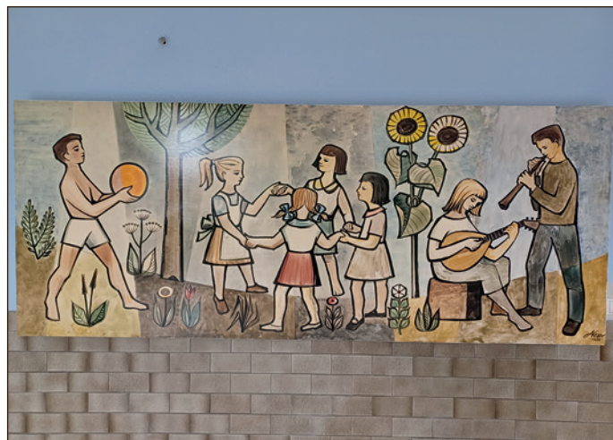
Unbeschwert und hell verleiht das Bild, gemalt mit reinen Pigmentfarben auf Pappuntergrund im Format 2,70 Meter auf 1 Meter, dem Raum eine ungeahnte Leichtigkeit: Das Werk von Albrecht Nesper.