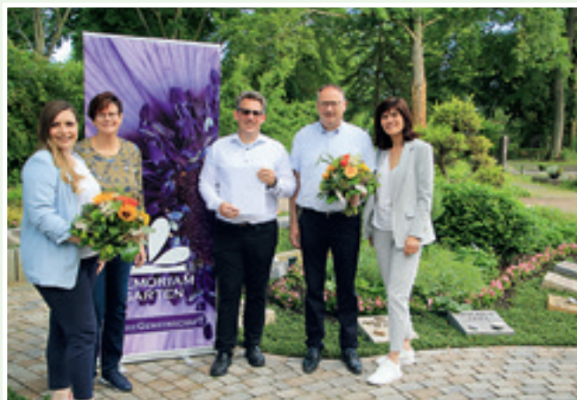
Auf dem Bild von links nach rechts, aufgenommen am 27.05.2024 auf dem Friedhof Rheingönheim, Memoriam Grabfeld:

Der Memoriam-Garten bietet eine Möglichkeit, um den Hinterbliebenen einen liebevoll gepflegten Erinnerungsort zu schaffen. Der Memoriam-Garten soll bis Ende des Jahres umgesetzt sein.